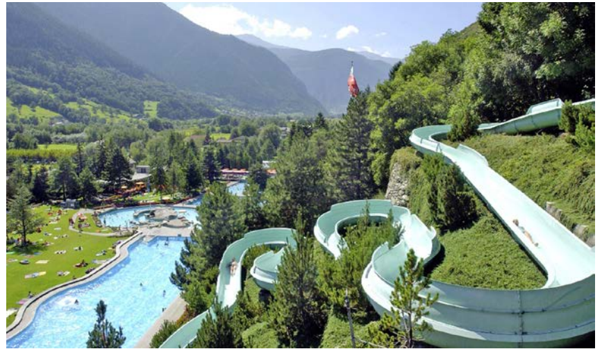
Eines der Highlights in Brigerbad: die 184 Meter lange Aussenrutsche