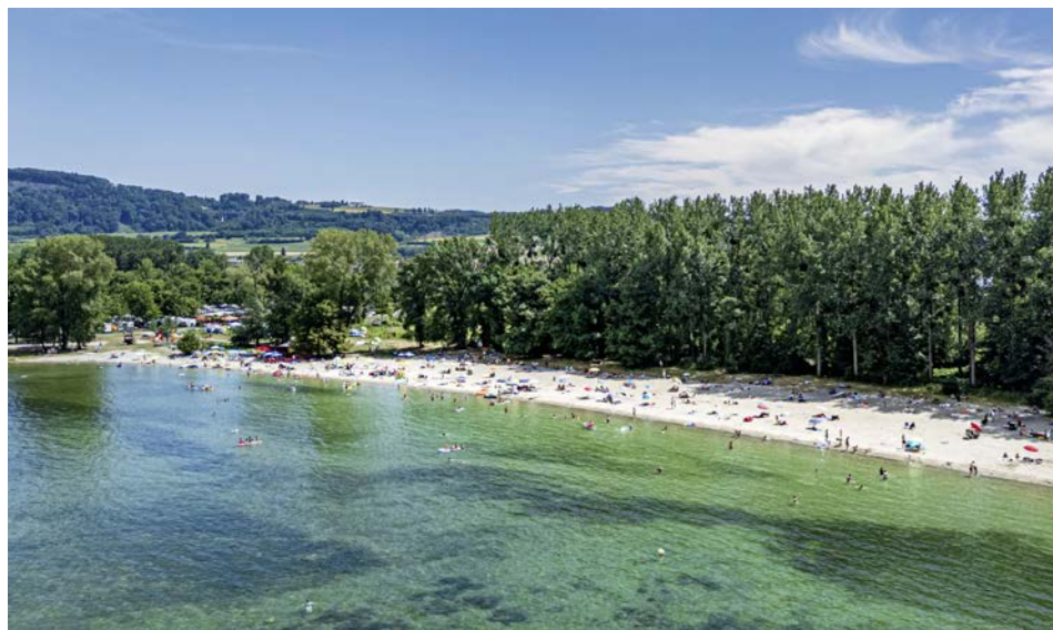
Campen am grössten Sandstrand der Schweiz: Yvonand am Neuenburgersee