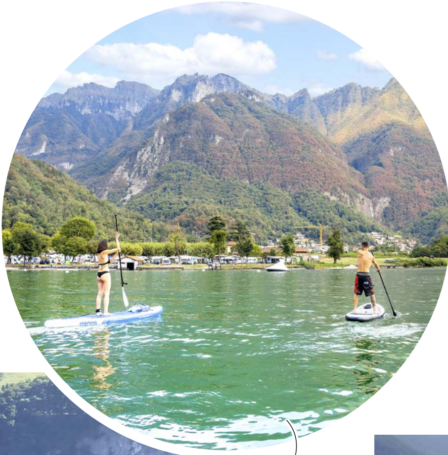
Cool: Stand-up-Paddeln am Fuss des Monte Generoso