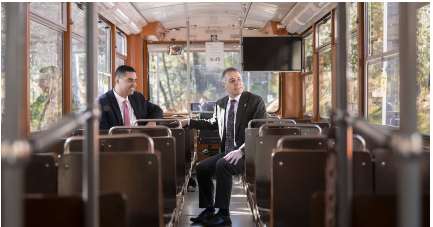
Borg e Cassis sul trenino del Monte Generoso

Il consigliere federale Ignazio Cassis ha ricevuto il ministro degli Esteri maltese Ian Borg