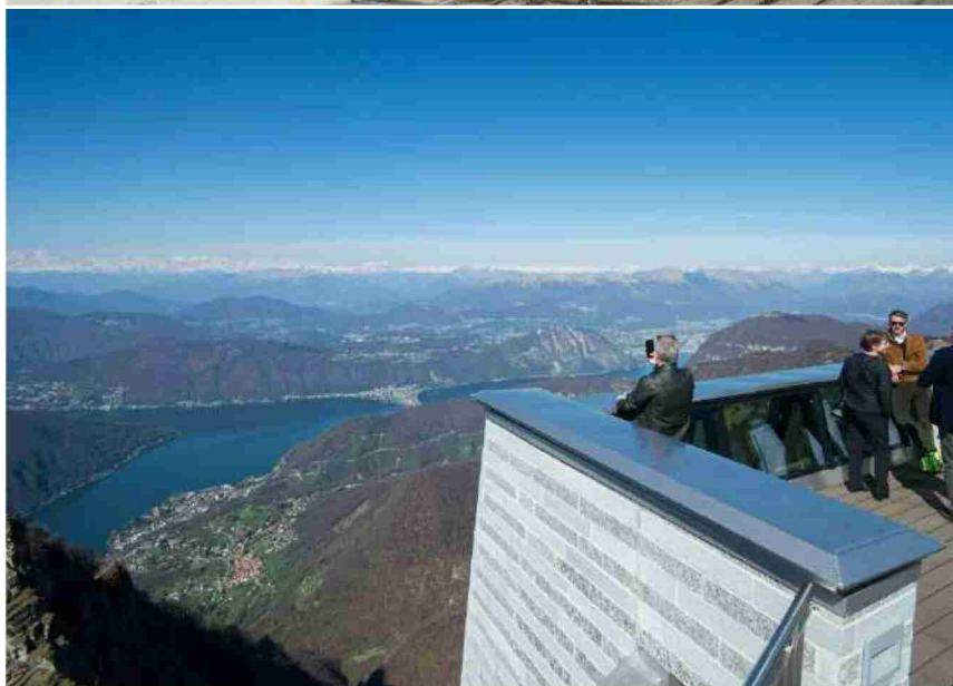
Una vista mozzafiato