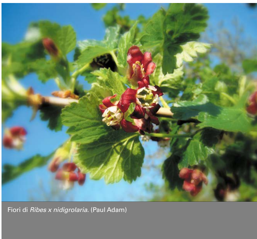
Fiori di Ribes x nidigrolaria . (Paul Adam)

Piantate in posizioni soleggiate e con terreni concimati, le sue varietà si sviluppano velocemente sia nella classica forma naturale ad arbusto, sia nella più seguita forma a spallie-